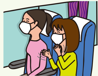
通常通り座席をご使用いただけます