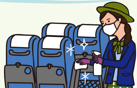
車内の消毒を徹底しています