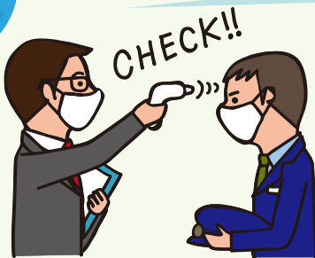
乗務員の体温をチェックしています