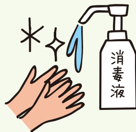
乗車時に消毒をお願いします